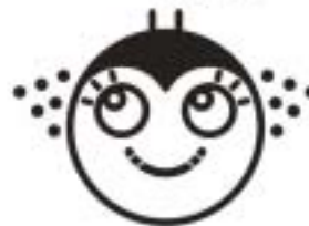
Animation when comfort (change phase 1, 2, 3, 1... For every 2 seconds)