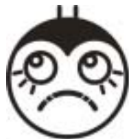
Animation when Dry or Wet

>>> EL turns on 5 sec when change to comfort